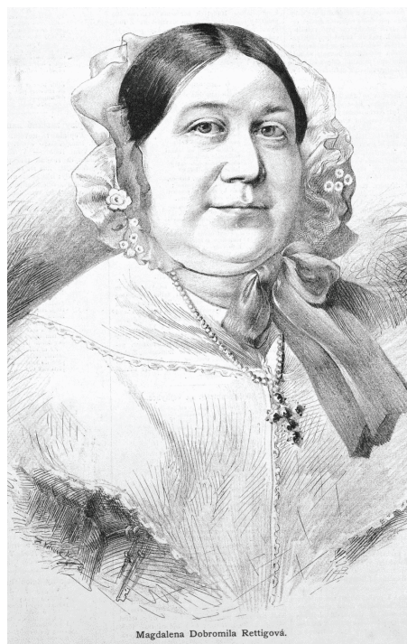
Magdalena Dobromila Rettigová.