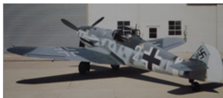
Messerschmitt Bf 109 G-6