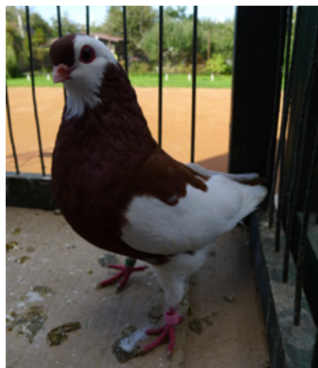
Vítěz holubů - Rakovnický kotrlák červený sedlatý chovatele Dušana Barcucha