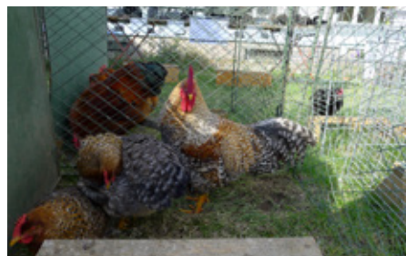
Vítěz drůbeže - Bílefeldská slepice rodobarvá chovatele Jiřího Herynka