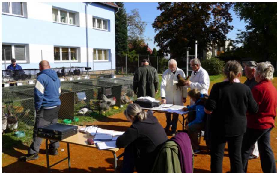
Atmosféra při posuzování zvířat