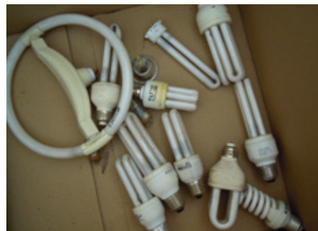
Nové sběrné místo na úsporné žárovky bude brzy také na Městském úřadě v Proseči.

Více se o problematice nakládání s nefunkčními zářivkami dočtete na www.ekolamp.cz .