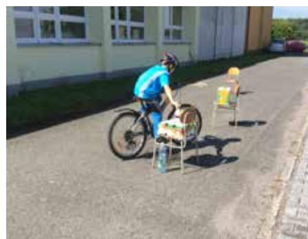
Pedagogický sbor 1. stupně