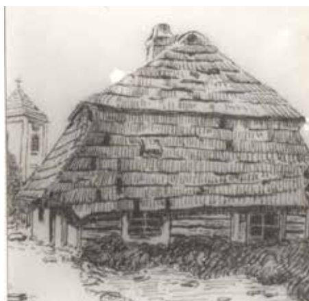
Farní katolická škola v Proseči