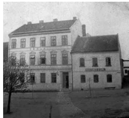
Devítiletá škola v Proseči