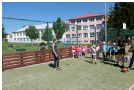
Pedagogický sbor 1. stupně ZŠ