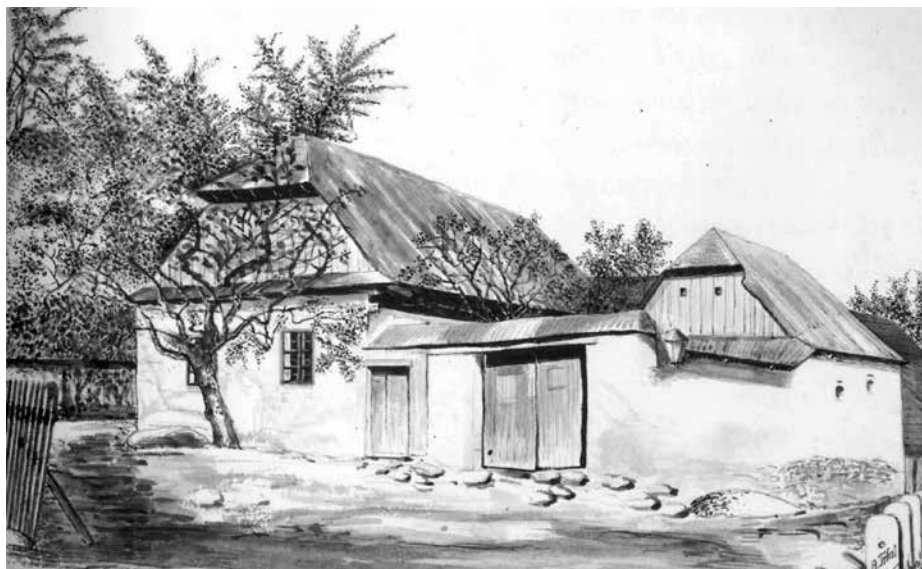
Stará evangelická škola v Proseči