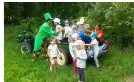
Pohodové léto všem popřáli i malí Cvrčci, dost vody na koupání popřál vodník Fanda a slíbil, že po létu bude pro děti zase zpátky.