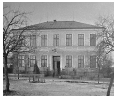
Nová evangelická škola v Záboří