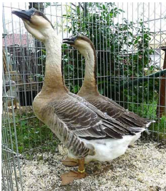
Stránku připravil Jiří Herynek